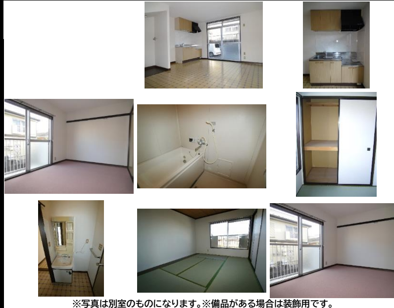
※写真は別室のものになります。※備品がある場合は装飾用です。

初期費用キャンペーンは、賃料・管理費・24時間安心サポート2料(当月+翌月分)、賃貸保証料全て込みです。※仲介手数料・月額火災保険料・鍵交換費用(任意)は別途必要となります。※賃貸借契約開始後1年未満に解約、又は契約締結後～契約開始日まで解約の場合は違約金として「賃料・管理費・24時間安心入居サポート2料」の2ヶ月分相当額、賃貸借契約開始後2年未満に解約の場合は違約金として「賃料・管理費・24時間安心入居サポート2料」の1ヶ月分相当額をお支払い頂きます。