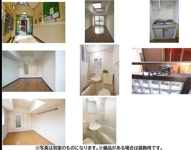
※写真は別室のものになります。※備品がある場合は装飾用です。

賃料発生日ご相談下さい！初期費用キャンペーンは、賃料・管理費・町会費・24時間安心サポート2料(当月+翌月分)、賃貸保証料全て込みです。※仲介手数料・月額火災保険料・鍵交換費用(任意)は別途必要となります。※キャンペーン適用時、賃貸借契約開始後1年未済に解約の場合又は契約締結後～契約開始日までに解約の場合は違約金として、賃料・管理費・の2ヶ月分相当額。2年未済は1ヶ月相当分。