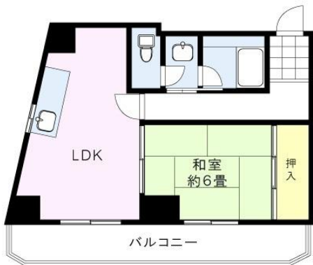
※図面と現況に相違がある場合は、現況を優先と致します。※80m=1分

宅配ボックス・防犯カメラ・ごみ置き場・自転車置き場新規設置！清瀬ひまわりフェスティバル会場からすぐ。ペット飼育時は月額賃料プラス3,000円、敷金プラス1ヶ月。(※解約時全て償却。別途原状回復費用がかかります。)鍵交換必須。火災保険料は月払いタイプになります。※1番手が先行申込、2番手が先行契約の場合は無条件で2番手が繰り上がります。)