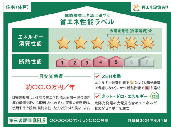
▲国土交通省 省エネ性能表示制度ガイドラインより

これは建築物を取引する際に、図のような省エネ性能ラベルを表示する制度で、特に4月以降に建築確認申請が行なわれる新築物件については、売買・賃貸する事業者に表示の努力義務が課されることとなります。